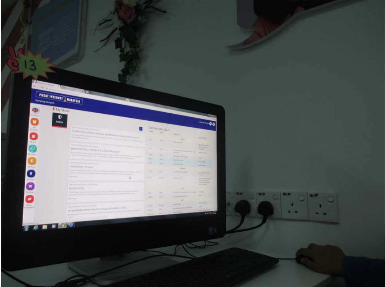
Salah seorang pelajar melihat pengumuman di MySkool